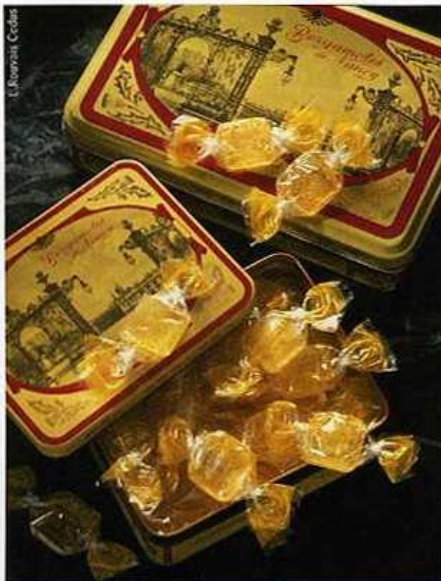
La recette du bonbon à la bergamote est secrète