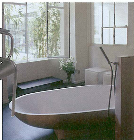
Le nouveau showroom B'Bath, rue du cherche-Midi à Paris

B'Bath a quitté la rive droite pour s'installer rive gauche dans un showroom de 300 m 2 , rue du Cherche-Midi. Deux anciens ateliers sur cours ont été réunis pour faire de ce lieu une vitrine de la création contemporaine en matière d'équipement de salle de bain. Principal partenaire, Agape y expose ses pièces d'exception, Ufo, une baignoire en inox émaillée dessinée par Giampaolo Benedini, la baignoire ovale Spoon, et la douche en spirale Chiocciola sur fond de carreaux de pâte de verre Bisazza, avec robinetterie Hansgrohe, Fantini ou TGH. Il manquait à Paris un Showroom de cette ampleur, le groupe Balas, holding familiale regroupant les entreprises Balas, Meresse Entreprise, Framaco Entreprise, Delamare et B'Bath vient d'y remédier. Entreprise indépendante créée en 1804, Balas développe un chiffre d'affaires de 63 millions d'euros et compte 550 collaborateurs qui se partagent dans trois grandes spécialités du bâtiment : la couverture, la plomberie et le génie climatique et travaillent sur des chantiers d'envergure: du palais de l'Elysée, au Piazza Athénée au technocentre Renault. B'Bath profite de l'expérience de l'entreprise Balas et assure ses aménagements grâce à la présence d'un bureau d'études dans le showroom. La plomberie ne manque pas d'avenir.